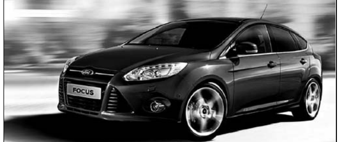
Abbildung zeigt Ford Focus Titanium mit Wunschausstattung gegen Mehrpreis.

FORD FOCUS TREND MIT GRATIS SELECT paket 1