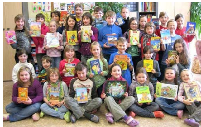
Alle Teilnehmer mit ihren Lieblingsbüchern