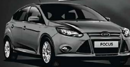
Abbildung zeigt Wunschausstattung gegen Mehrpreis.

20% Sondernachlass + 1,99% eff. Jahreszins!