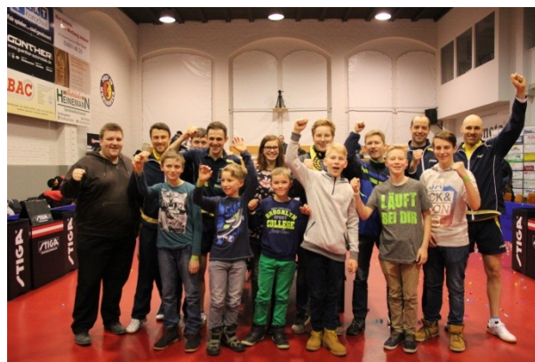
Die feiernden Heinsdorfer und Mühlhäuser.