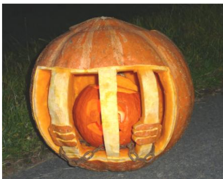
Der „Schönste“ zur Kürbisnacht 2014.