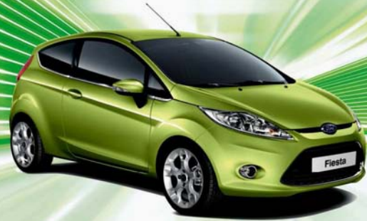
Abbildung zeigt Wunschausstattung gegen Mehrpreis.

Voller Erfolg - verlängert bis 30. April! Für alle sofort verfügbaren Ford Pkw.*