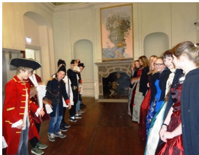
Schicke Mode im Stile des Barock

Anfang Mai bearbeiteten die siebenten Klassen der Oberschule eine Woche lang das Projekt „Sachsen im Barock“. Dazu gehörte auch ein Ausflug zum Schloss Wesenstein am 05.04.2017.