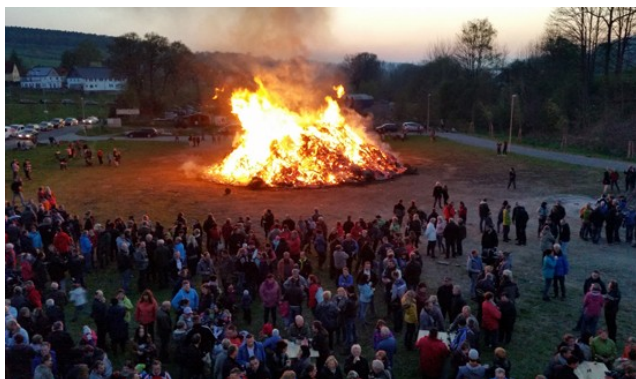
Die Feuerwehr Unterheinsdorf sagt allen Danke ob Helfer oder Gast für eine gelungene Party.