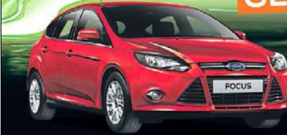
Abbildung zeigt Wunschaus- stattung gegen Mehrpreis.

3 MONATSRATEN MIT DER FORD FLATRATE 1 GESCHENKT