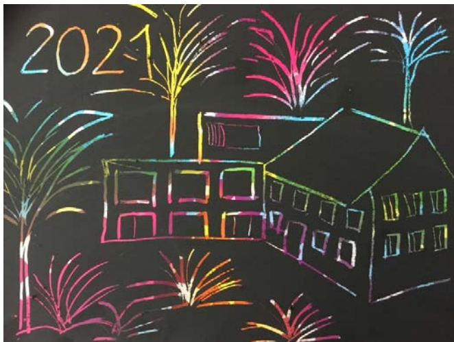
Gero Georgi, Klasse 2

Die Schüler und Lehrer der Grundschule Hauptmannsgrün wünschen alles Gute im Jahr 2021