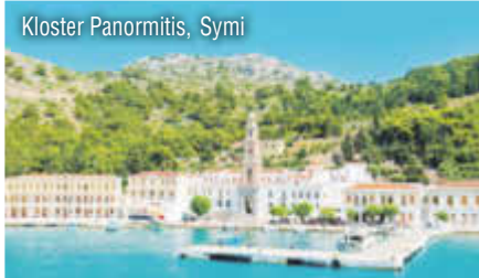
Kloster Panormitis, Symi